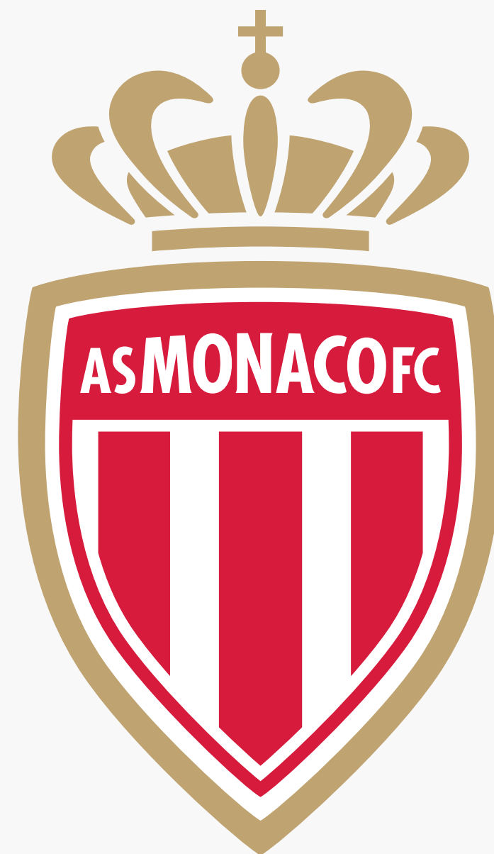
ON WHITE LOGO SUR FOND CLAIR